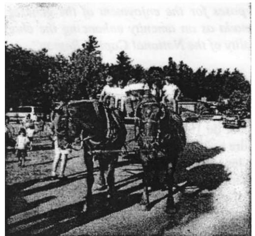
Souvenir du pique-nique 1999